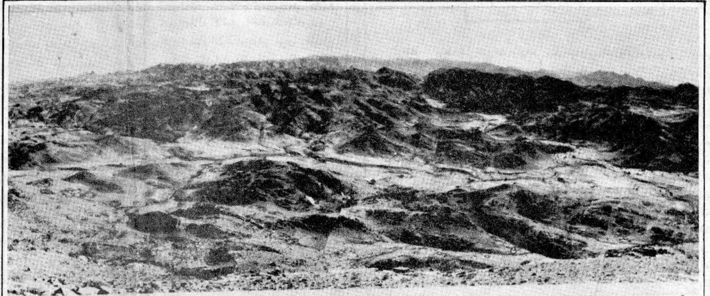
Fig. 2a: View of 'Arush from Gabal 'Urquh. In foreground, Wadi Nagid al-Abyad and Wadi ath-Tayyrah (Khwilan at-Tiwal).

كان مزدهراً في الماضي يبدو اليوم مهجوراً تماماً ، وغياب المستوطنات السبئية والحمرية في هذه المنطقة دليل على الاخلاء المفاجيء والقاطع لمستوطنات عصر ما قبل التاريخ . وتفسير هذه الظاهرة يجيء مرة أخرى من التحليلات الجيومورفولوجية والرسوبية ، ومن الضرورة الآن انتظار نتائج تحاليل العينات المأخوذة من الطبقات الرسوبية لأجل تحديد تاريخ هذه الظاهرة بصورة أدق وأكثر انضباطاً . ومع ذلك فإن هذا الاخلاء من المؤكد أنه كان يتعلق بحركة تكتونية جديدة ربما صاحبها تغير في المناخ . وأدت الزيادة المفاجئة في